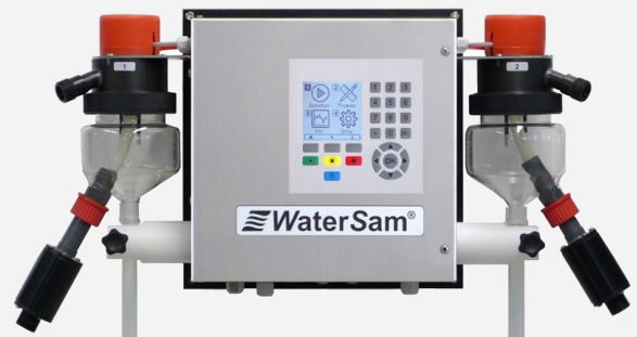
WS 98 mit zwei Probenahmesystemen (FMWW)